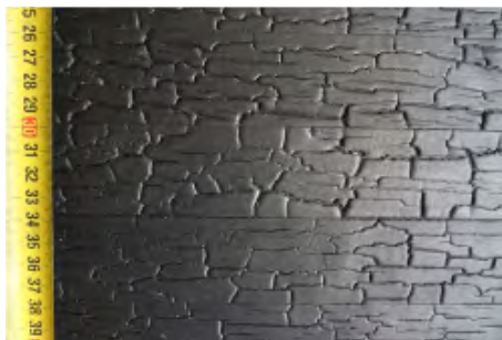
Sanuki met bekantrechte latten (45mm breed)

Naast een duurzame oplossing voor wandbekleding, is Sanuki ook zeer geschikt om originele meubels, deuren en andere objecten van te maken.