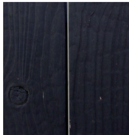
Processus de vieillissement du Takamatsu